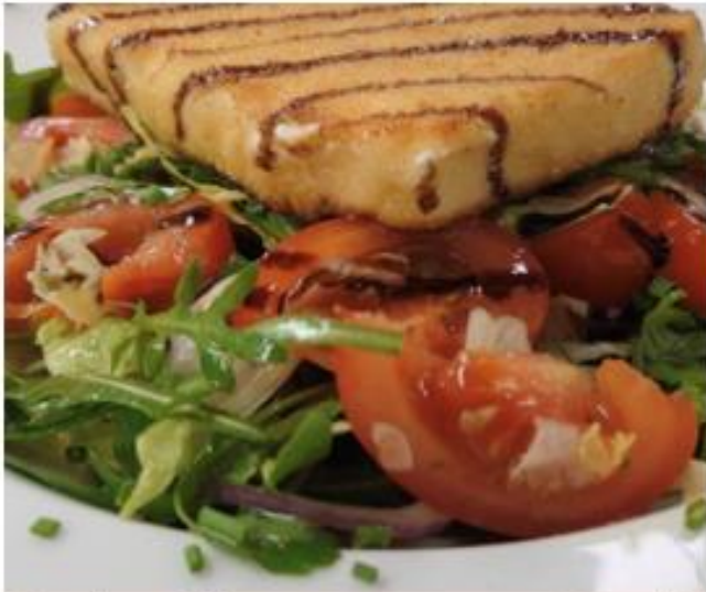
Schafskäse vom Grill auf buntem Salatbeet