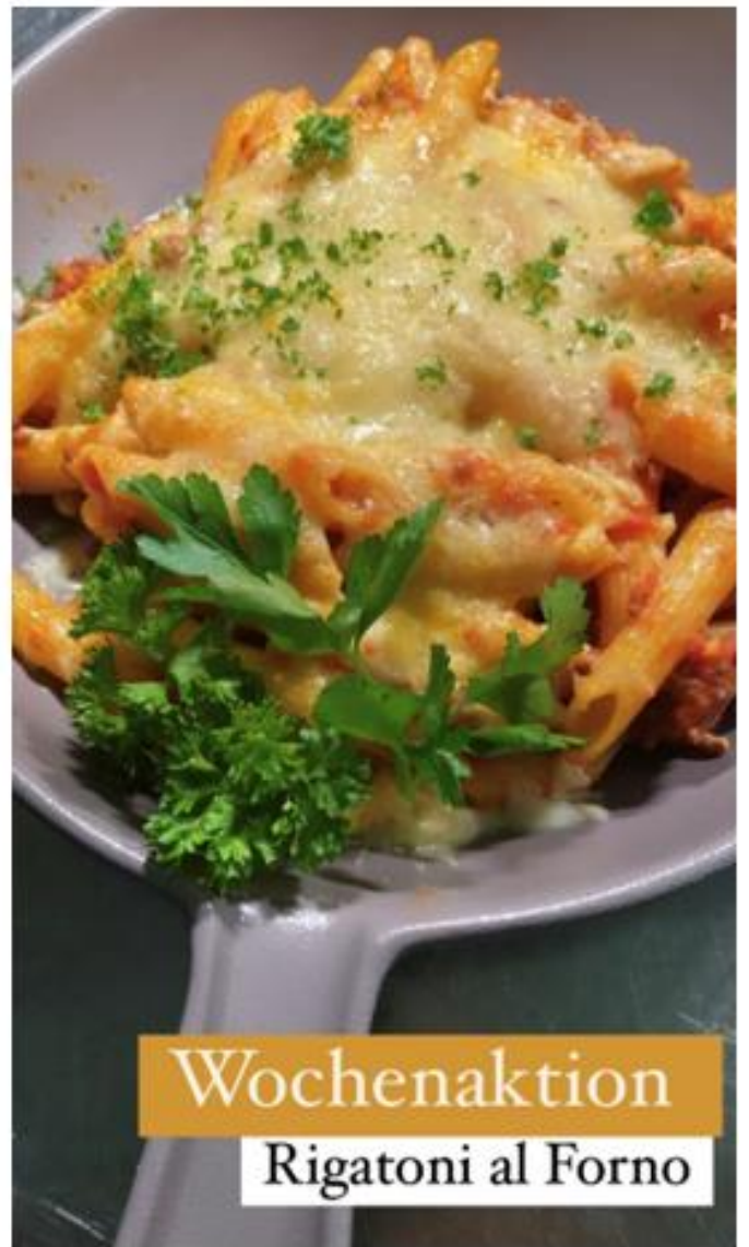
Wochenaktion Rigatoni al Forno